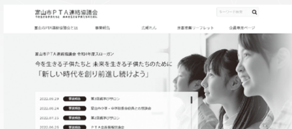
富山市P連ホームページ

各小中学校から出向いただいている運営委員の皆様と様々なテーマについて調査・研究したことをまとめた要望書の作成や、親学び講座の開催、各小中学校のPTAの連携や情報共有を図るためのホームページの運営、また私たちの事業や活動を紹介する広報紙の作成等を行っています。