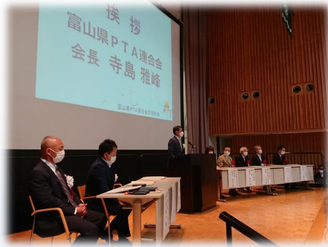
寺島前会長による開会挨拶