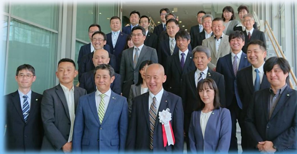
令和4年度の役員32名