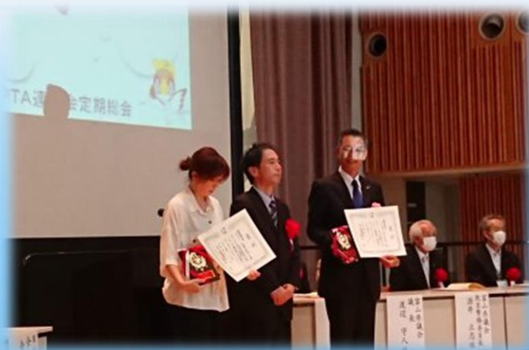
最優秀賞を受賞された2団体