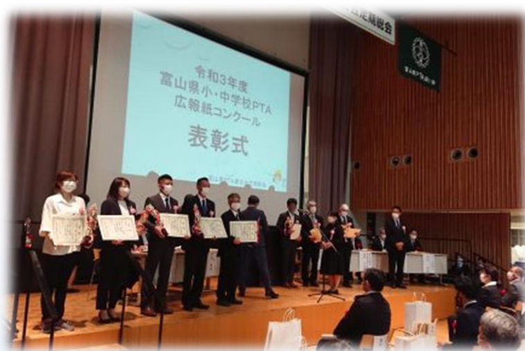
広報誌コンクール表彰式