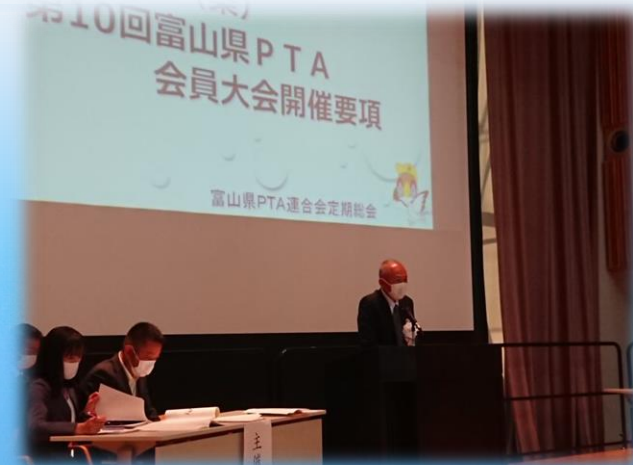
令和4年度のスローガン・活動方針説明