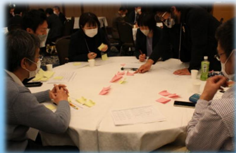
グループディスカッション