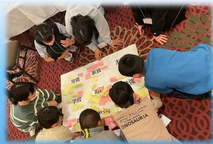
グループディスカッション