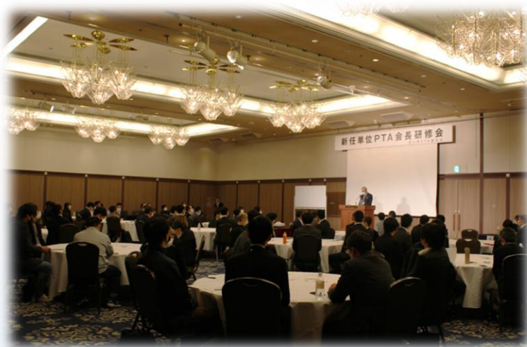
役員合わせ総勢100名以上が参加