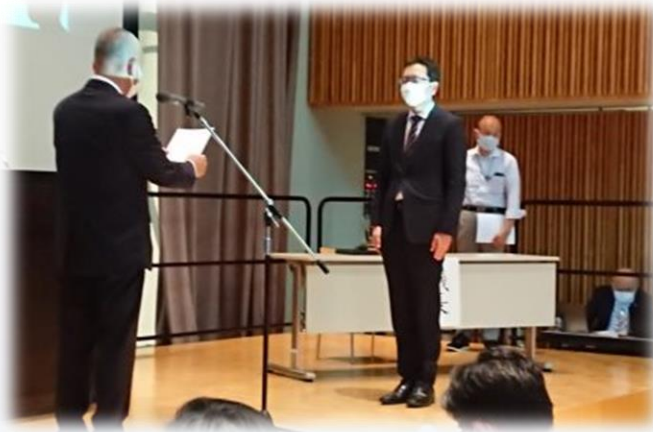
研究指定、分科会発表PTAへの委嘱状交付