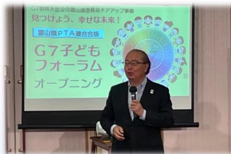
新田知事のご挨拶