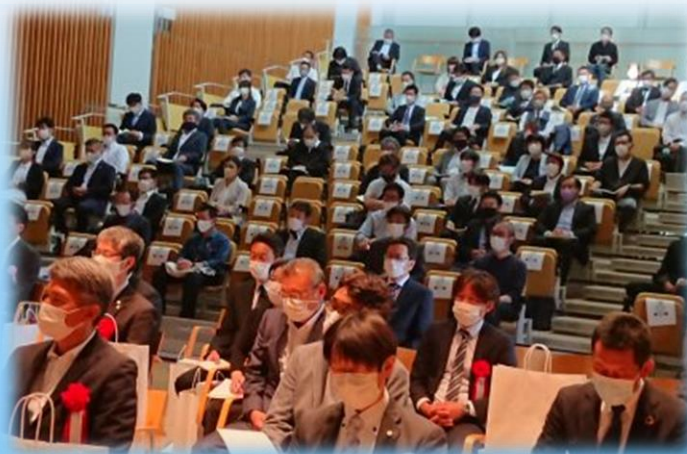
参加いただいた代議員、受賞者の皆様