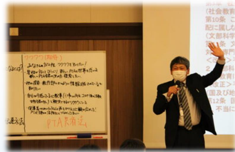
講演：PTA会長さんの聞きたいこと話したい事（水谷講師）