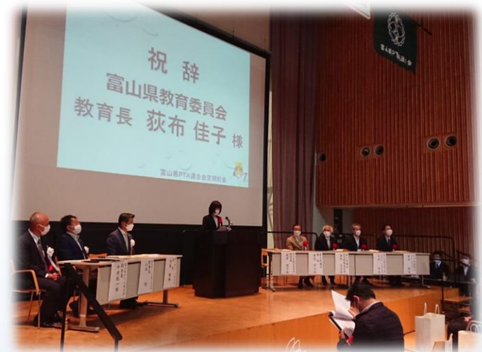
荻布富山県教育長様からの祝辞