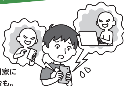
パソコンや携帯電話等を使ったいじめの認知件数