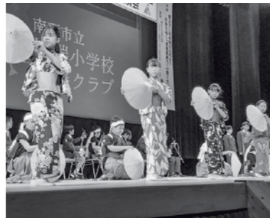
城端小学校民謡クラブ