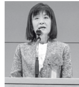
荻布富山県教育委員会教育長