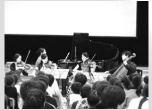
聞きほれたピアノ五重奏

11月13日(水)、県文化振興財団主催の学校コンサートが開催されました。子供たちや保護者も、普段聴くことのできないピアノ五重奏の生演奏を、心待ちにしていました。