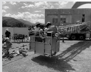
高所救助作業車への搭乗体験

城端小学校PTAは「家庭」「学校」そして「地域」が常に緊密に連携して活動しています。8月25日(日)に行われた「南砺市総合防災訓練」に城端教育振興会の協力で行なっているPTA学年活動「わくわく体験」として5・6年生が参加しました。