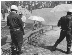
水害を再現した大雨洪水体験