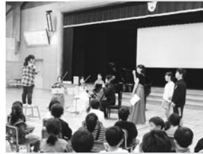
みんなで学んだ指揮の仕方