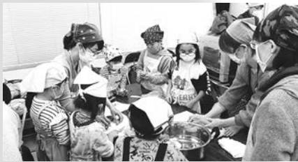
親子で楽しく調理

平米小学校PTA、定塚小学校PTAの協力で合同土曜学習「キッズレストラン」が12月7日(土)に行われました。